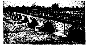
①-1 盧溝橋 北京西、永定河の橋。

盧溝橋は、全長266.5メートル、橋の欄干に姿形がすべて異なる大小485頭の獅子の石刻が施され、マルコ・ポーロが世界で最も美しい橋とたたえたことでも有名です。今年、盧溝橋事件70周年記念行事も。