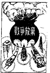
1947年文部省発行の「あたらしい憲法のはなし」戦争放棄の項より

南相馬市内の高校の卒業式に卒業生全員や、成人式に新成人に贈呈するとかイベントの時や、署名協力者などにプレゼントするとか・etc.