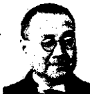
吉田 茂 日本自由党他