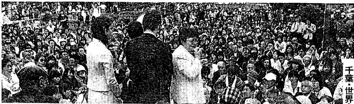
守ろう9条 会場外も人・人・人

●仮にもノーベル賞受賞者が来日し、3日間で二万人もの人が集まり、国際的な平和を求める大集会でしたが、大新聞やテレビ局はあまり取り上げてくれませんでした。▼5月5日付『朝日新聞』コピー