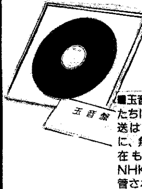
■玉音盤は抗戦派將校たちに発見されず、放送は8月16日の正午に、無事行われた。現在も東京・港区のNHK放送博物館に保管されている玉音盤。

●15日正午、日本国民は何ごとの放送かといふかしみ、若いも若きもラジオの前に立った。君が代の奏楽につづいて天皇の声(玉音・ぎょくおん・ぎょくいん)が電波に乗って流れ始めた。すべての国民にとって、初めて耳にする「現人神(あらひとがみ)」の声だった。(筑摩書房『一日一史』より)