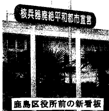
鹿島区役所前の新看板