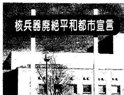
小高区役所前の新看板