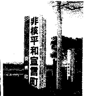
旧鹿島町の旧看板

▲左から原町・小高・鹿島の各区役所前の新設看板。右は現在も残る旧鹿島町の「非核平和宣言町」看板 ○昨年6月24日に南相馬市議会は、合併で消滅していた「核兵器廃絶平和都市宣言」を改めて全会一致で可決しました。そしてこのほど、ご覧のように小高区役所前と鹿島区役所前に、立派な「核兵器廃絶平和宣言都市」の看板が新設されました。○これも私たち市内4つの「九条の会」(「はらまち」「小高」「鹿島」「相双教職員」)が昨年2月16日に「再宣言を行う要望書」を提出し、議会に働きかけたためと思われる。少しだけ、ささやかですが、私たちの活動が市議会を動かしたことになるのでしょうか。<会報No.92・93・102・114に掲載、報告いたしました>