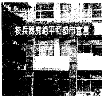
南相馬市役所前の看板