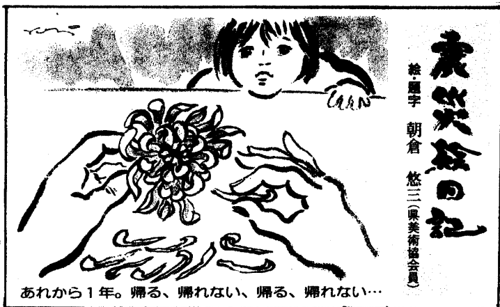
あれから1年。帰る、帰れない、帰る、帰れない...