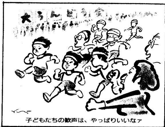
子どもたちの歌声は、やっぱりいいなア