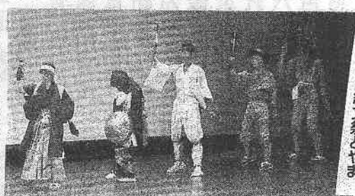
はばたけ 高校生 高松文祭とやま